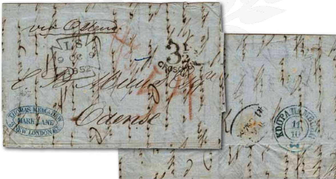
Abbildung D.14 — 09.10.1852: Portobrief aus London (Lombard Street) via Ostende nach Odense. 3½ sgr (circa 4,2 d) Britischer Anteil, 3½ sgr Anteil Postverein, insgesamt 7 sgr (in blau notiert). Umgerechnet in 9½ Schilling (in rot notiert). Umgerechnet in 31 Skilling. 23 Skilling für Dänemark. Insgesamt 54 Skilling (in rot notiert). Von den Anteilen für den Postverein und Großbritannien entfiel für den Transit jeweils ½d an Belgien. Die hohe Gebühr von 23 rbs für Dänemark (statt 13 rbs) kann sich durch die höhere dänische Gewichtsstufe und eine Zustellgebühr erklären.

Am 01.08.1852 trat eine Änderung des Britisch-Preußischen Postvertrages in Kraft, die eine spürbare Gebührenreduktion mit sich brachte. Auch die Gründung des Deutsch-Österreichischen Postvereins (DÖPV) wurde in diesem Vertrag berücksichtigt. Für Post nach Dänemark auf dem Laufweg über Aachen wurde die Gebühr für einen einfachen Frankobrief auf 11½d reduziert. Es galt durchgängig die britische Gewichtsprogression. Diese Gebühr teilte sich auf in 4d für