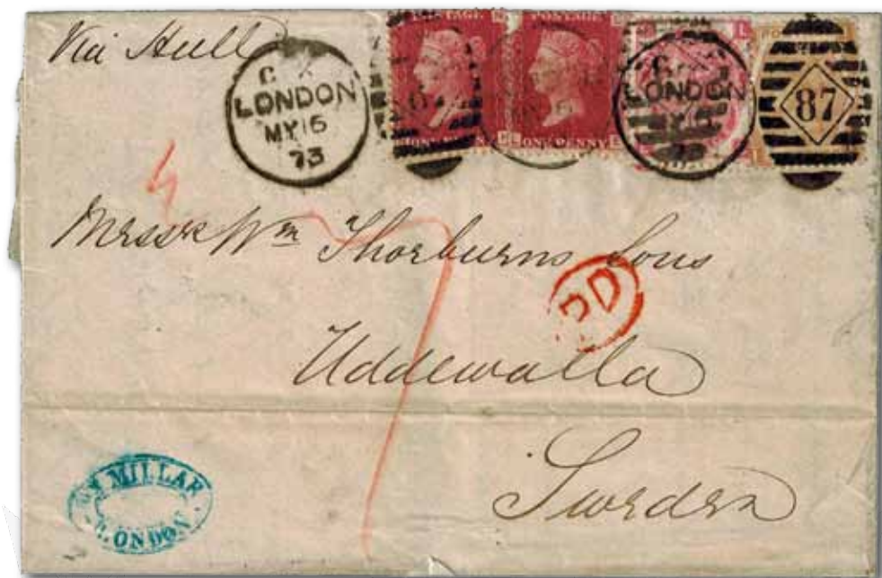
Abbildung S.45 — 16.05.1873: Frankobrief (Doppelbrief) von London nach Uddewalla. Sehr ungewöhnlich frankierter Brief der zweiten Gewichtsstufe, bezahlt mit 2 \times 5d = 10d plus 1d Late Fee. Der Schweden zustehende Betrag von 7d ( 2 \times 3\frac{1}{2}d) wurde handschriftlich in Rot notiert. Rückseitig Durchgangsstempel von Göteborg vom 19.05.