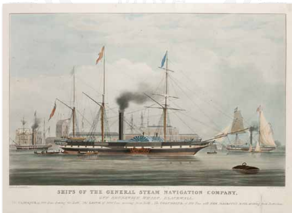
Abbildung A.1 — Bei den ersten Dampfschiffen handelte es sich häufig um Schaufelraddampfer, die aber auch auf hoher See zum Einsatz kamen. 1

Bereits 1824 wurde die »General Steam Navigation Company« (GSNC) gegründet, die sich schnell einen guten Ruf durch ihre Zuverlässigkeit und Pünktlichkeit erwerben konnte. Sie war das erste Schifffahrtsunternehmen, das mit Dampfschiffen operierte. Neben ihrem Kerngeschäft, einer Art früher Kreuzfahrten von London nach Margate mit jährlich mehr als einer Million