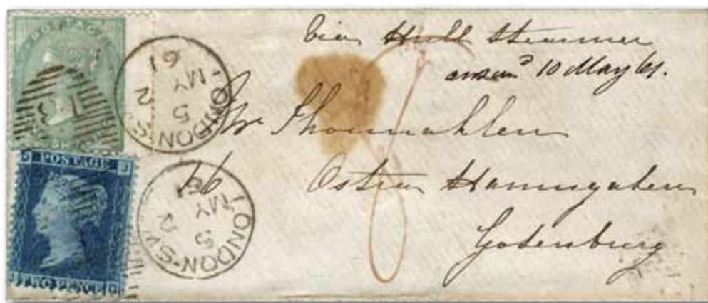
Abbildung S.40 — 02.05.1861: Frankobrief London via Hull nach Göteborg. Zum März 1859 war der britische Hafen für die Postschiffe nach Göteborg nach Hull verlegt worden. Die Gebühr für einen einfachen Brief bis zu einer halben Unze Gewicht blieb allerdings unverändert bei 1s 2d. Schweden stand ein Anteil von 8d am Franko zu. Der Brief ist rückseitig ungestempelt.

Abbildungen einiger Verrechnungstempel, mit denen der schwedische Anteil festgehalten wurde, finden sich im Kapitel A.6.