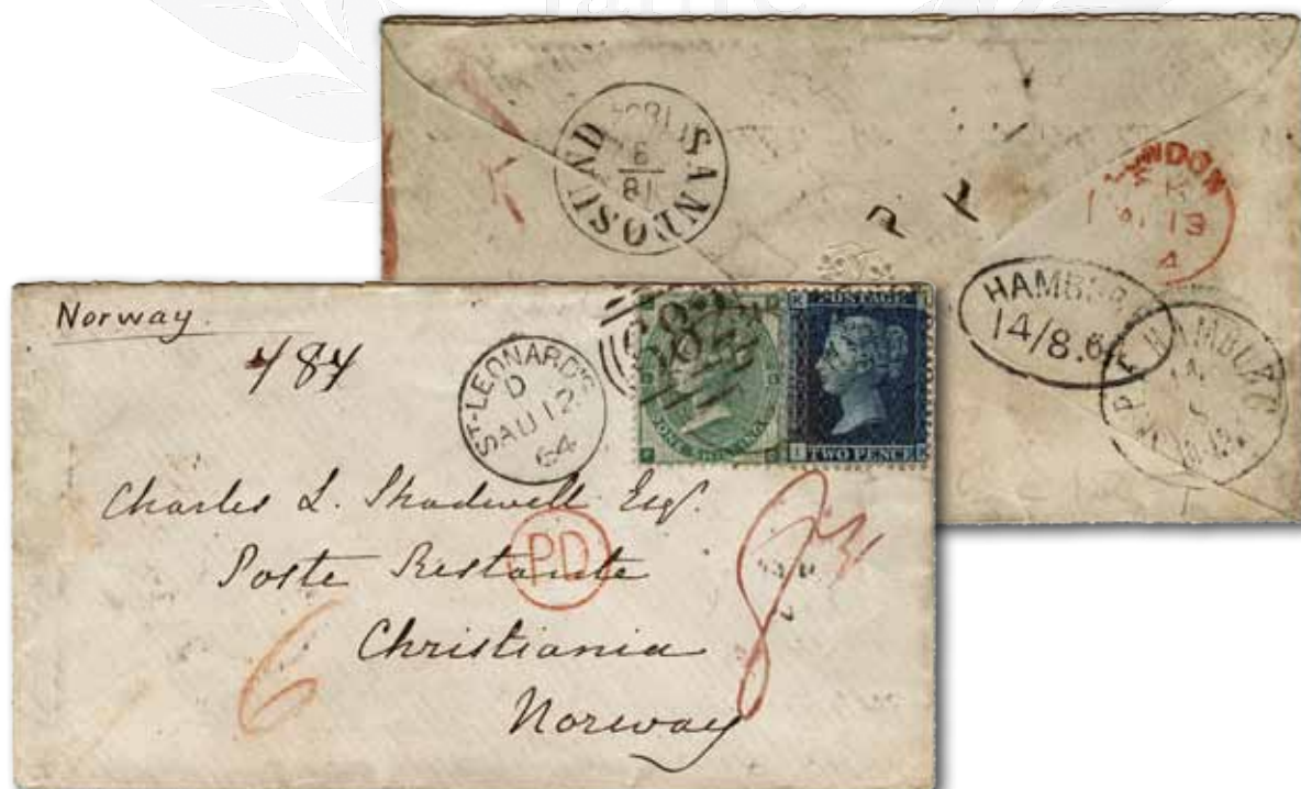
Abbildung N.15 — 12.08.1864: Frankobrief von St. Leonhard's via Belgien und Hamburg (14.08.) nach Christiania. Die Beträge 8½ sgr (Summe der Fremdgebühr) bzw. 6 sgr (Anspruch Norwegen an den DÖPV) sind mit Rötel vermerkt. Rückseitig sind die Stempel des Stadtpostamts Hamburg sowie der neu eingeführte Stempel der dänischen Abteilung des Stadtpostamtes Hamburg vom 14.08. abgeschlagen. Ebenfalls findet sich der Stempel des norwegischen Grenzpostamts Sandösund vom 18.08.